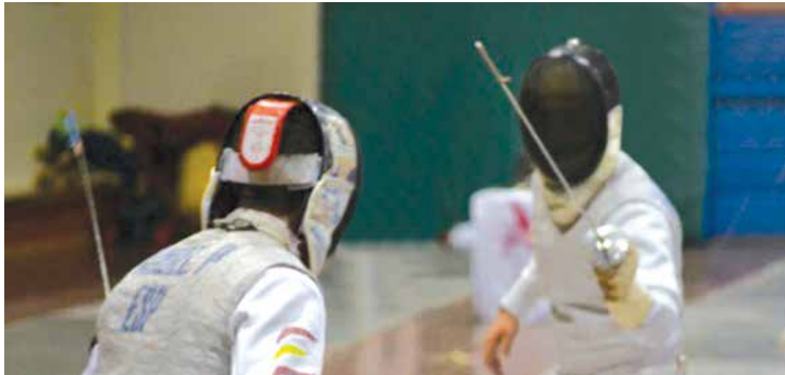
Asalto de florete en un reciente Campeonato de Andalucía.

A día de hoy, la esgrima más comúnmente conocida y extendida es la modalidad olímpica de esgrima deportiva. Como su propio nombre indica se trata de un deporte, un deporte muy reglamentado cuyo objetivo principal es ganar. Esto significa casi automáticamente la pérdida de ciertos valores intrínsecos del arte tanto a nivel técnico como espiritual; pasamos de un arte de combate, guerra y duelo al de dos individuos cubiertos de cables persiguiendo que su luz se encienda. Aun así, la modalidad deportiva sigue manteniendo parte de la esencia marcial de su origen: en lo físico, lo técnico y lo estratégico. Es por eso que muchos la consideran el ajedrez del deporte.