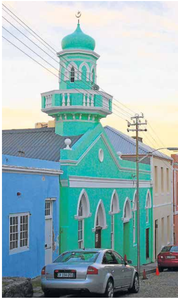
Mezquita en el Bo-kap, Ciudad del Cabo.

Ahora la comunidad musulmana afronta el reto de unirse bajo la autoridad de un solo emir , hecho que llevará al establecimiento del Din en la región y a la abolición de la riba y la injusticia del sistema káfir , con el permiso de Allah.