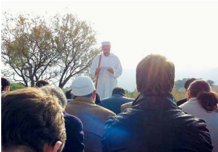
Oración del Id al Adha en El Cerro del Aceituno, Granada

Tras la oración, algunos musulmanes se van a sacrificar sus animales, otros se dirigen con sus familiares y amigos a desayunar, aunque algunos no tienen más remedio que volver a sus puestos de trabajo, para más tarde, a la hora de la comida, encontrarse todos nuevamente para compartir juntos la alegría, el valor y la emotividad de este día, marcado en rojo en todos los calendarios de los musulmanes.