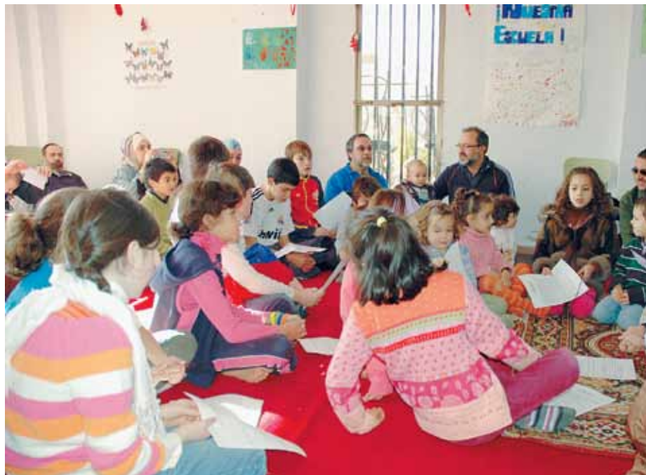
Niños celebrando el día festivo de Ashura en Pulianas