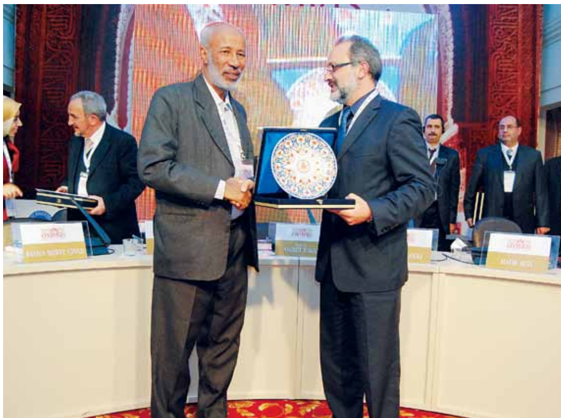
19 de noviembre de 2011. Symposium Internacional sobre al-Ándalus en Estambul

Allah es el Señor del Universo, Suya es la victoria. Le pedimos que nos proteja de la tentación de pretender cambiar la dirección de la historia. Él es el Señor de los Mundos.