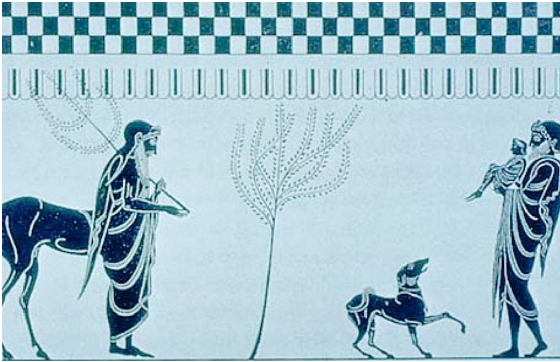
Peleo presenta su hijo Aquiles al centauro Quirón

Creo que estaremos todos de acuerdo de que un planteamiento firme para los próximos años radica en tomar gradualmente la cuestión educativa en nuestras manos, en menoscabo del control absoluto que hoy día ejerce el Estado sobre ésta.