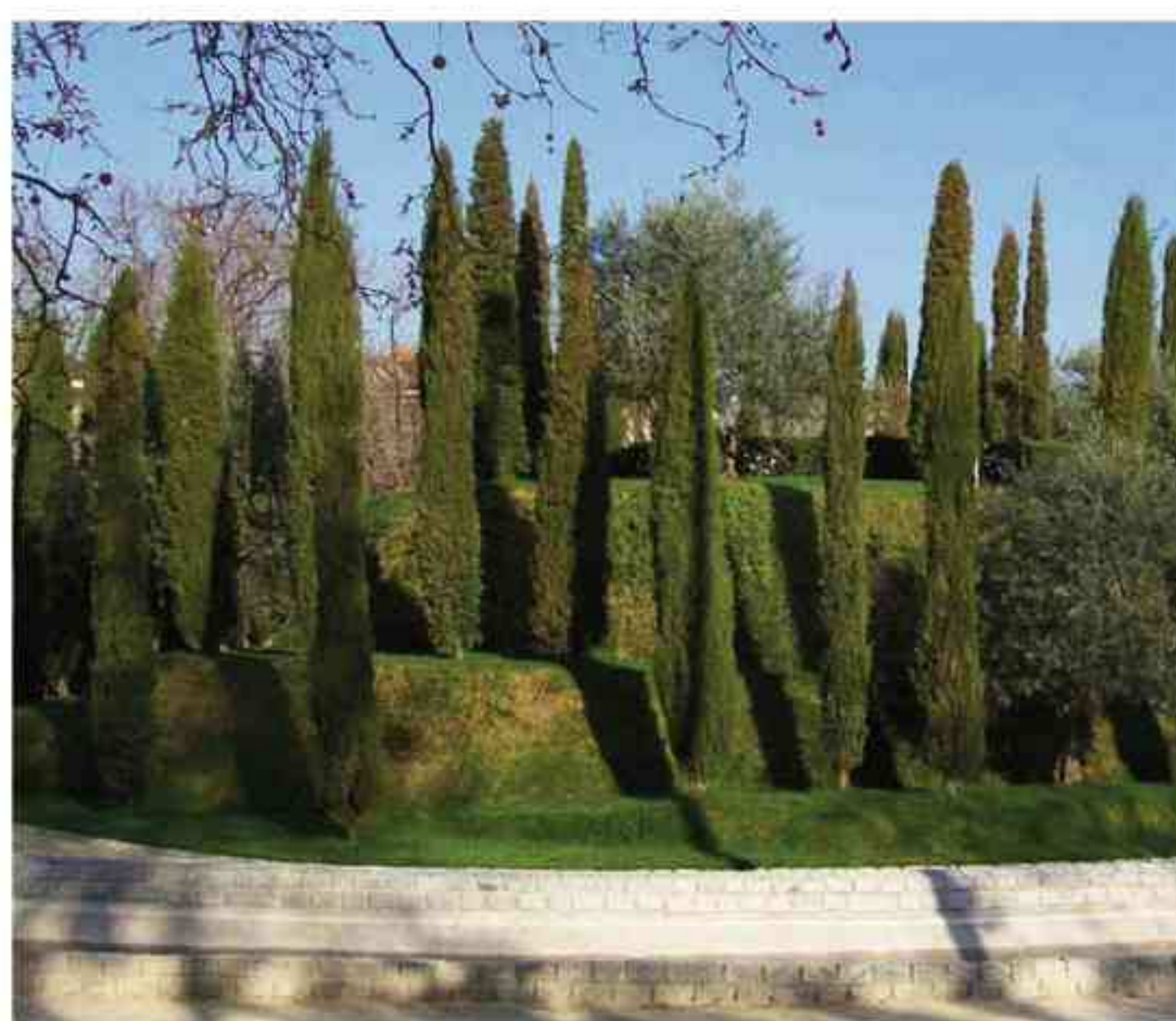
El Bosque de los Ausentes, en la chopera del parque del Retiro. Madrid

experimento se realizó —y aún no ha concluido—, con población musulmana, raptada por los servicios de inteligencia y transportada ilícitamente hacia ese limbo jurídico.