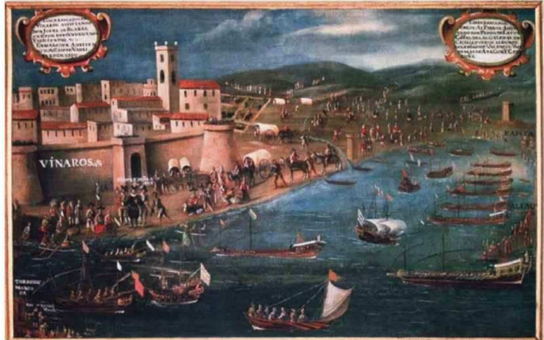
Embarco de los moriscos desde el Grao de Vinaroz, Valencia, en el año de 1613 d.C.

Por eso, a su lucha contra la ocupación cristiana de las tierras de los Awqaf —el maná de Allah— tomó en nuestros días el nombre