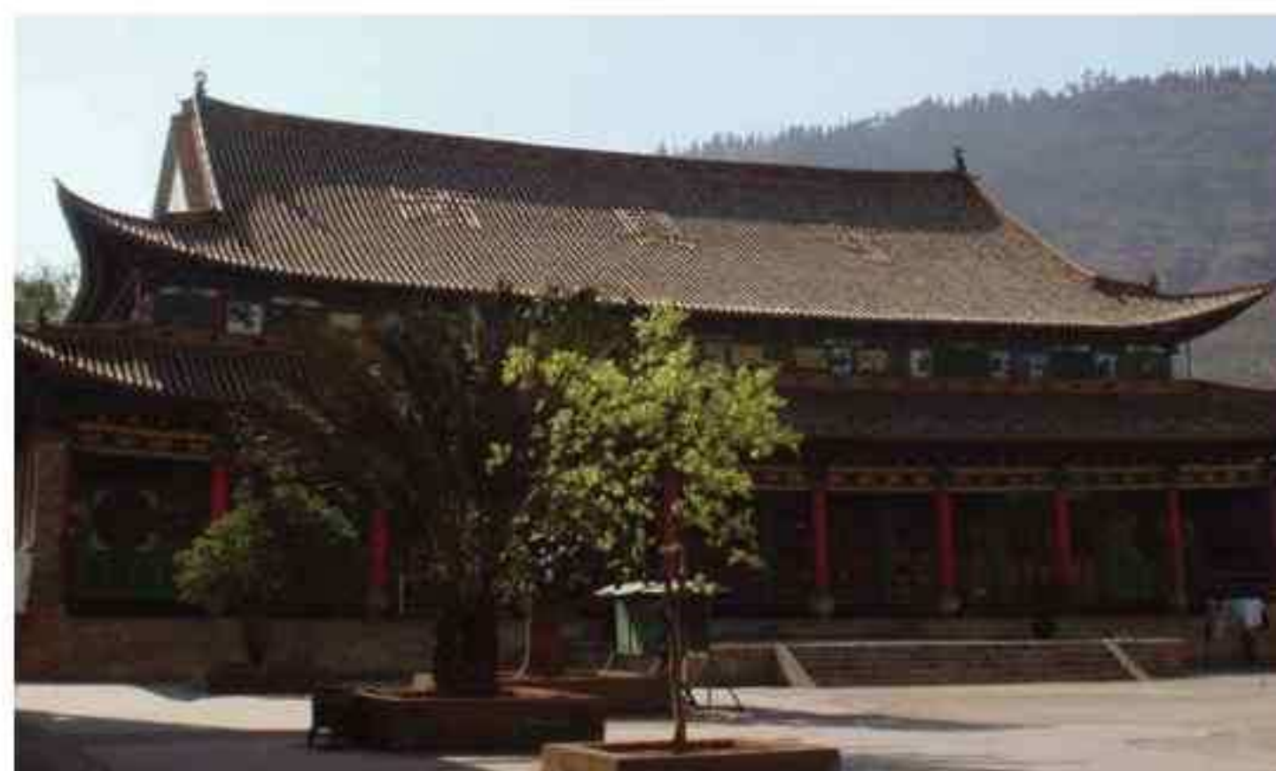
Mezquita de Gucheng en la provincia de Yunnan, al sur de China

A lo largo de los años, los musulmanes establecieron mezquitas y madrasas en las que había estudiantes que provenían de lugares tan distantes como Rusia e India.