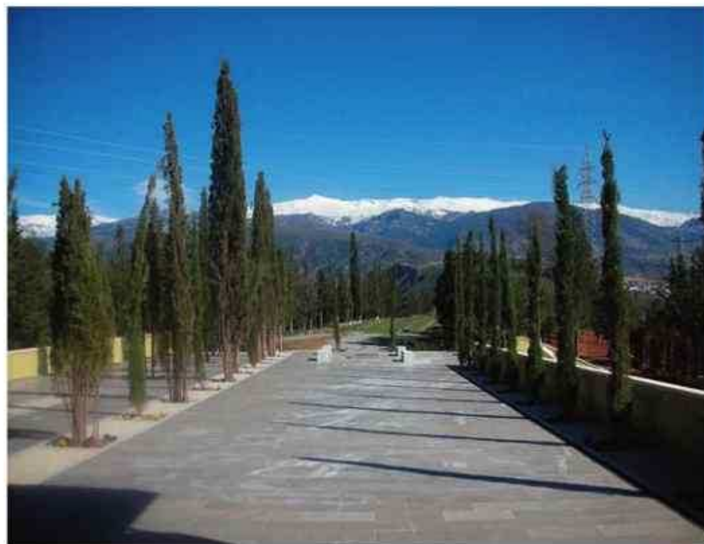
La Rauda de Granada, cementerio islámico de la ciudad

El denominado 'Patio Islámico' se creó durante la Guerra Civil española para los fallecidos de la guardia mora creada por Franco, que ocupan unas 50 tumbas, pero no fue hasta 1980 cuando se retomó ahí el entierro de los muertos de la comunidad musulmana asentada en Granada, formada por unas 25.000 personas, en toda la pro-