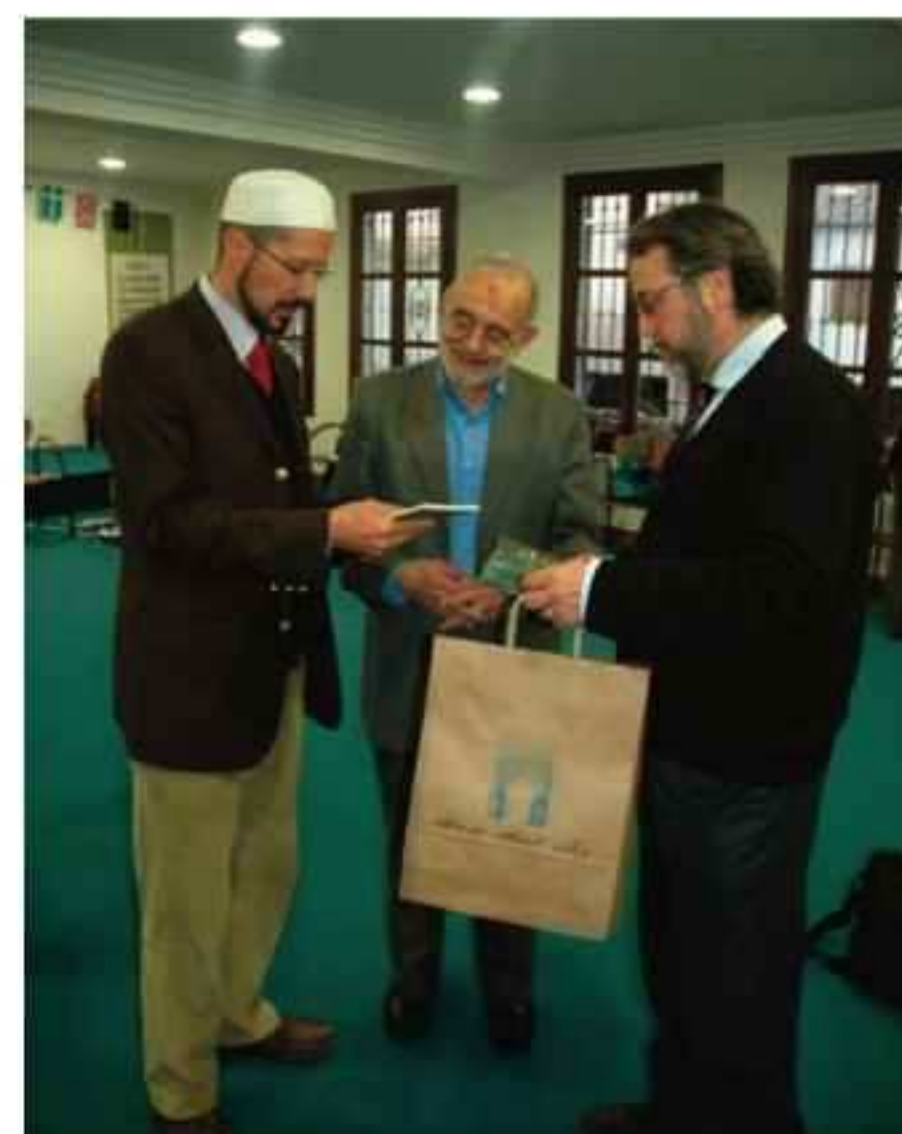
Dr. Jamal Badawi recibe unos ejemplares de su libro en español 'El Profeta Muhammad en la Biblia', publicado por la Comunidad Islámica en España.

El fenómeno del llamado "diálogo interreligioso" es una creación del Vaticano y responde a una política de "normalización" de las relaciones con otras religiones en el entramado del sistema dominante, del cual la Iglesia es pilar fundamental. Un sistema materialista, dominado por los poderes financieros que ha traspasado los límites divinos, en el cual los musulmanes son percibidos, con razón, como un desafío peligroso para la supervivencia del presente estado de