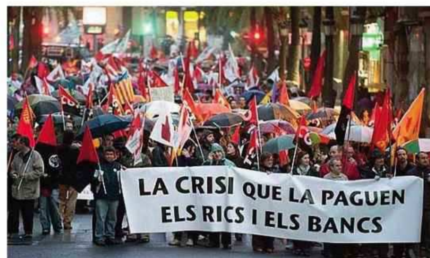
El principal yihad de nuestros días es contra la injusticia de la usura

La prohibición del asesinato se encuentra en la base del Mensaje Revelado.