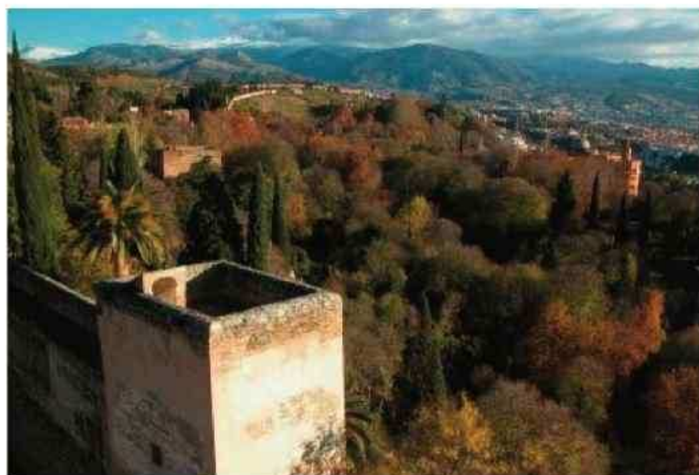
Panorámica de los bosques de la Alhambra donde se encuentra el cementerio musulmán.