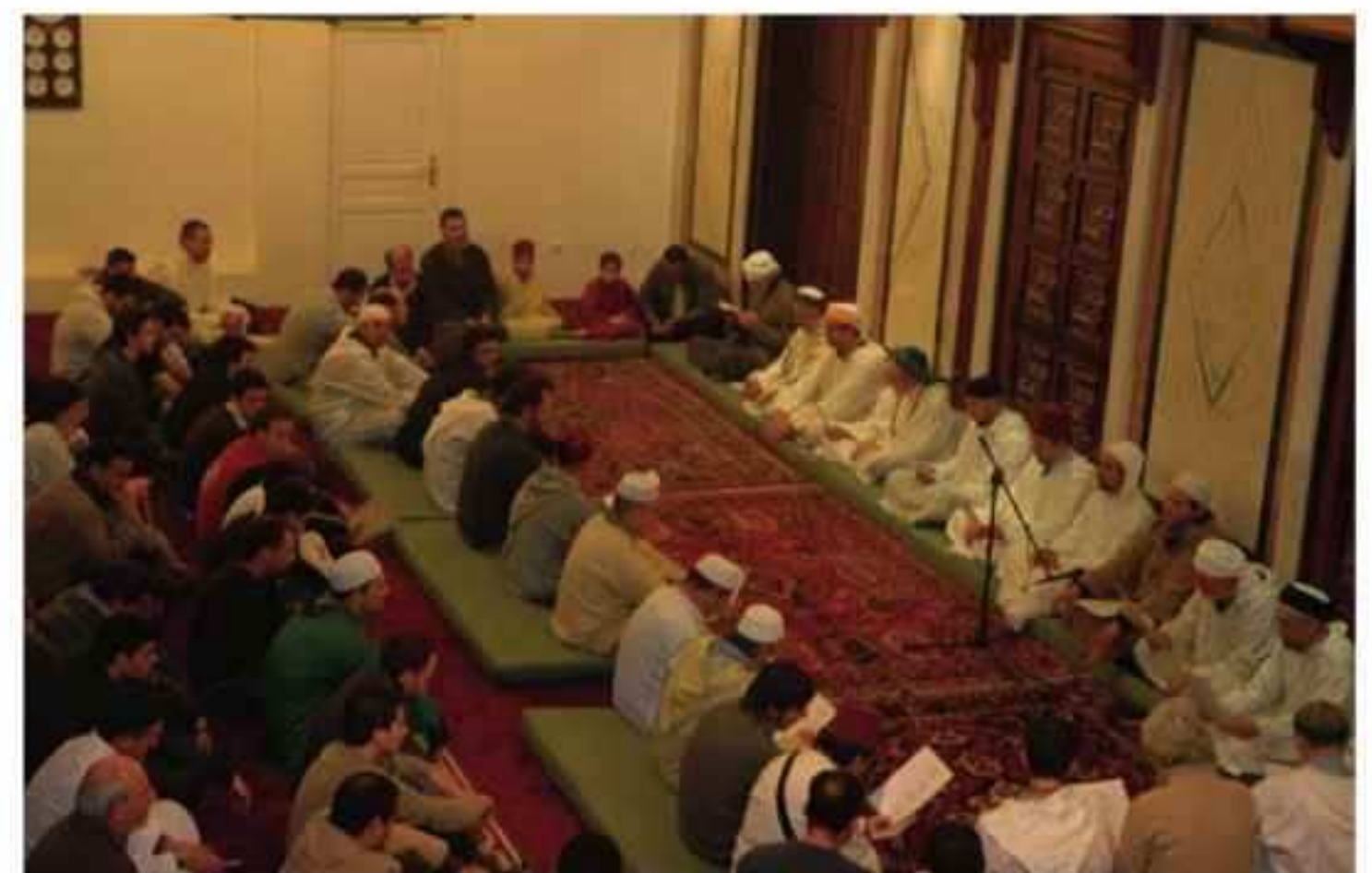
Celebración del Maulid en la Mezquita Mayor de Granada

Maulud es un acto de profundo conocimiento basado en una experiencia del corazón: el amor. Profundo conocimiento ya que estamos celebrando el momento en el que el proceso creacional alcanza su cénit con la aparición de aquél que es su primera causa y su objetivo, pero este conocimiento no es un conocimiento intelectual, sino que es un conocimiento que surge de la experiencia que origina el acto de seguir su hermoso