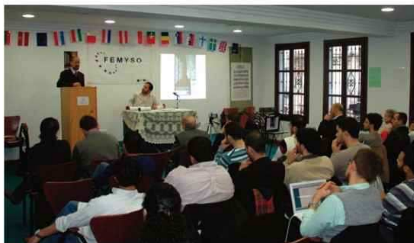
Palabras de bienvenida a los participantes en las Jornadas

Entre los días 4 al 9 de marzo, el Centro de Estudios Islámicos de la Mezquita Mayor de Granada acogió unas Jornadas de Formación para jóvenes líderes de las comunidades musulmanas de diferentes países de Europa. Las Jornadas estaban organizadas por el Forum de organizaciones de Jóvenes y de estudiantes musulmanes de Europa (FEMYSO) y patrocinadas por la European Youth Foundation , dependiente del Consejo de Europa. Partici-