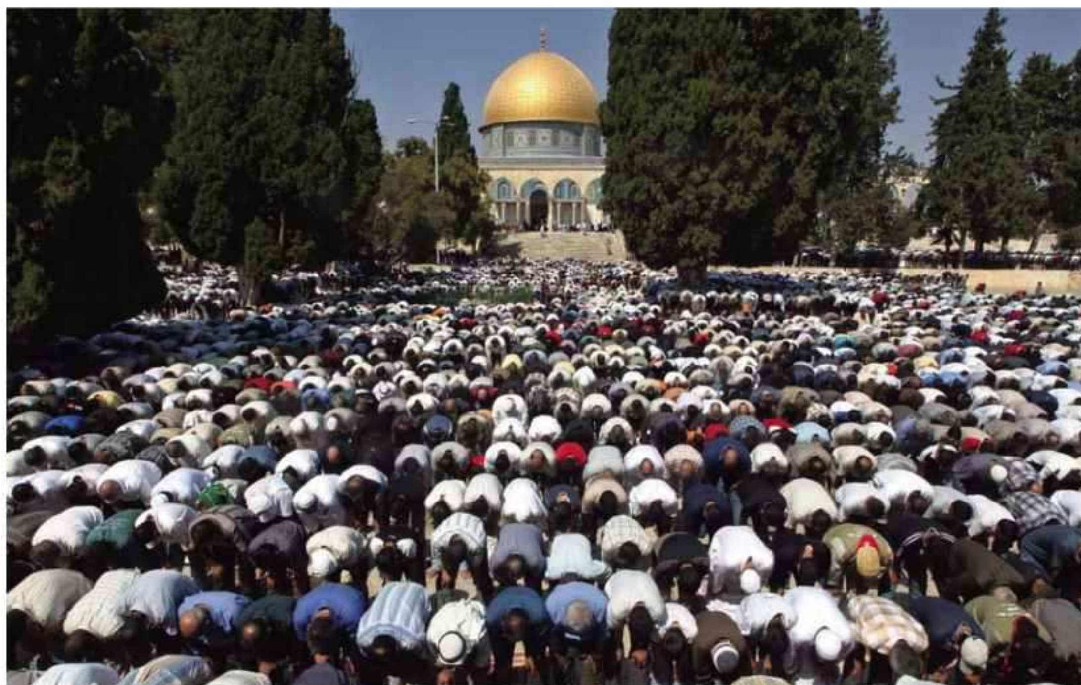
La oración es el acto más elevado de orden, disciplina, y cohesión

tura de la población. De esta forma, las personas pueden ser masivamente programadas —se convierten en incapaces de cuestionar—, y pasan a ser dirigidas desde fuera: a ser sumisas y no subversivas al sistema.