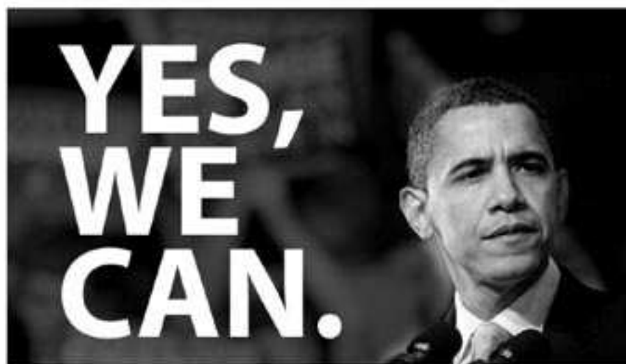
Obama y su famoso eslogan electoral. El cambio empieza en él.

Muchas cosas se han dicho del nuevo presidente y de su pasado musulmán, hasta el punto que sus detractores llegaron a decir que era un 'musulmán encubierto'. Parece más bien que su relación con el Islam se limita a un mero