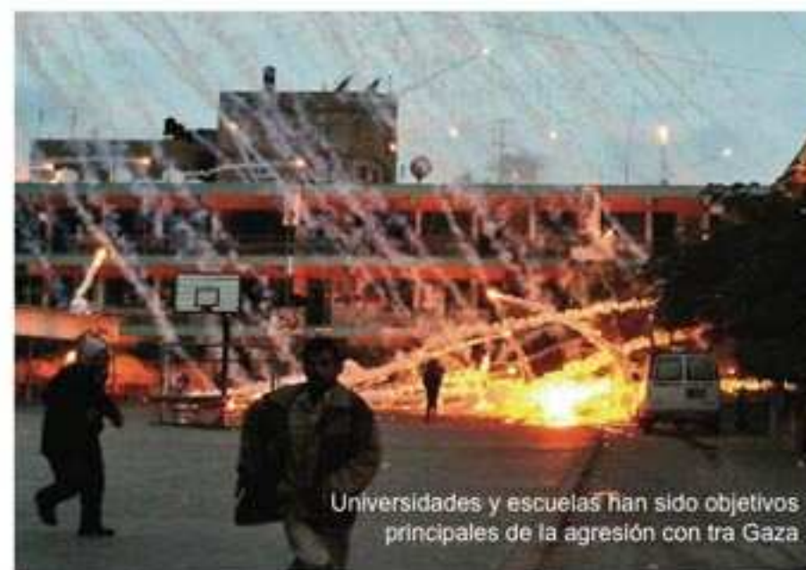
Universidades y escuelas han sido objetivos principales de la agresión con tra Gaza.

La respuesta adecuada exige en primer lugar, y ante la magnitud de la potencia del monstruo, unidad de fuerzas. En Palestina y en el mundo musulmán. Fuerzas de la razón, de la cordura. No más ruindad y no más matanzas. Para empezar, los árabes deben poner en orden el patio corrupto y decadente de sus propias sociedades. El orden y la fortaleza sólo les vendrá a los árabes por el Islam. Lo dijo Umar ibn Al Jattab que Allah esté complacido con él, dijo: "No conseguís sobreponeros a vuestros enemigos por la fuerza de los medios materiales y de las armas, sino que lo hacéis gracias a