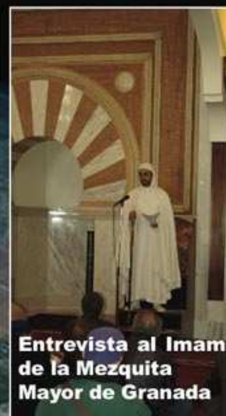
Entrevista al Imam de la Mezquita Mayor de Granada