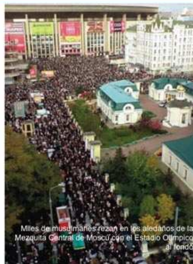
Miles de musulmanes rezan en los alrededores de la Mezquita Central de Moscú con el Estadio Olímpico al fondo.

Hablando de 'la religión como opio de los pueblos' no pudimos reprimir la curiosidad por ver la pirámide truncada en la que, en plena Plaza Roja de Moscú, está la momia del Faraón soviético, Mister Lenin. Decir Mister no es en realidad una incorrección si tenemos en cuenta que, durante nuestra visita y en la famosa Plaza Roja, estaba instalada una pista de patinaje sobre hielo flanqueada por un café al más puro estilo Starbucks americano; por la noche y enmarcadas por luces de neón de todos los colores, unas juveniles minifalderas arrullaban con sus canciones la tumba del faraón