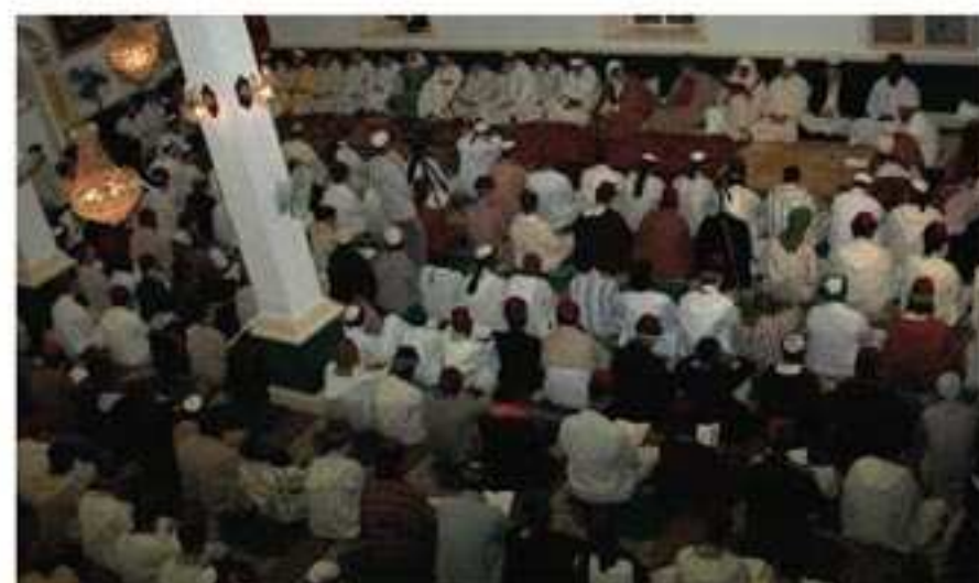
Moussem anual de Shayj Dr. Abdalqadir As Sufi

Éste es el terreno en el que incide él y profundiza el sufismo, el conocimiento de los ahwal (estados)