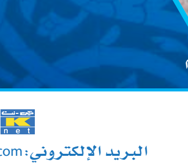
مشروع افطار الصائم