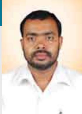
المشرف العام لإدارة العلاقات العامة والموارد

ومن حالات إشهار الإسلام التي تأثرت بها ذلك السائق الذي كان يعمل في الأصل خياطًا، وكان