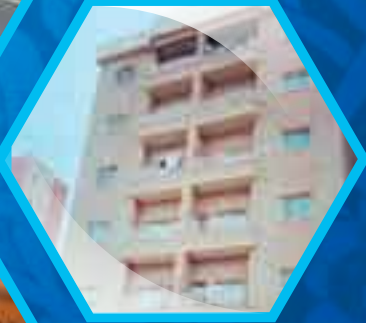
مشروع العمارة الوقفية

صالحة، ذكرت أنها كانت تأخذ كل ما تتعلمه بجدية تامة، فما ظنكم بأصول التربية الإسلامية والنهج النبوي في التربية لأغلى الناس على قلبها؟ اختارت لهم أفضل المدارس وجاءت لهم بالشيوخ والمحفظين للقرآن الكريم وحببتهم في القراءة وهيات لهم كل ما ينفعهم من الكتب، وأحاطتهم بحنانها فكانت تأخذهم بنفسها إلى النوادي الرياضية لتعلم الفروسية وركوب الخيل والسباحة وغيرها مما يحتاج إليه الشباب لغذاء الجسم والروح.