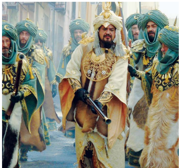
Las fiestas de moros y cristianos son habituales en multitud de ciudades del mediterráneo español.

Así habló Alavez, y saludando de nuevo cortés y respetuoso, volvió a internarse seguido de los suyos en la Ciudad, cuyas puertas se ce-