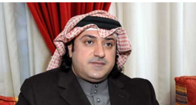
• الشيخ أمير آل فهد المالك السلطان الصباح