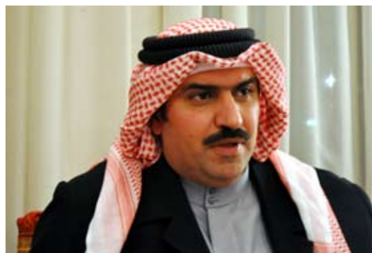
• الشيخ أمير آل فهد المالك السلطان الصباح

وكتب لهم مبلغ الترميم، ووقعت باسمي، فقال لي: أخبرك صدقاً؟ والدك هو من رمم المسجد قبل 20 عاماً.. وهذا الشيء كان حدثاً سعيداً بالنسبة لي، فمهما مضى من الوقت فعمل الخير لا ينسى.