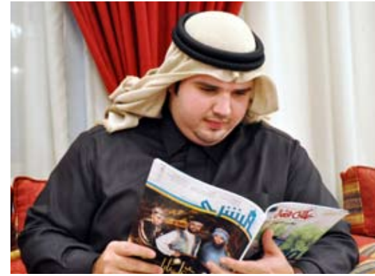
• الشيخ مالك آل فهد المالك السلطان الصباح