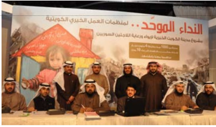
• «النداء الموحد» يطلق صحيفات الإغاثة عبر تلفزيون الكويت