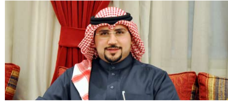
• الشيخ سلطان آل فهد المالك السلطان الصباح

نجد مكانا بها، وكذلك التيسير على الناس يفتح الأبواب أمام استقامة الأفراد، والعودة إلى الله عز وجل عند الخطأ أو الزلل.