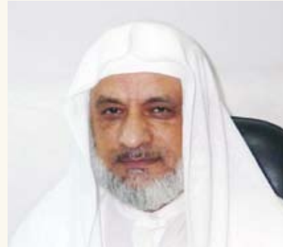
الإمام والخطيب في وزارة الأوقاف فضيلة الشيخ أمين عامر

يتعلم المهتدي الجديد في مدرسة الحج النظام، وكيف أن لكل نسك ميعاد وميقات، فلا شيء يسبق الآخر، بل كل شيء بترتيب ابتداء من وقت خروجه من بلده إلى أن يتم المناسك في أماكنها وأزمانها طاعة لله الذي هدانا وأكرمنا والرسول الذي علمنا حيث قال خذوا عني مناسككم.. في تجرد تام وخشوع وضراعة ورقة وتواضع